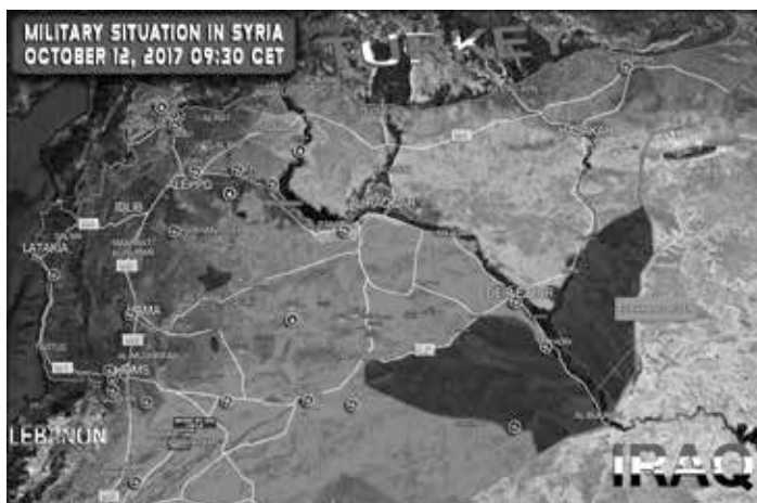
b1: Die militärische Situation in Syrien, Stand 12.10.2017. Unter Kontrolle der syrischen Armee stehenden Gebiete (rot), unter der sogenannten moderaten Opposition bzw. der Dschihadisten von al-Nusra und Co. stehenden Gebiete (grün), vom IS besetzte Gebiete (schwarz).