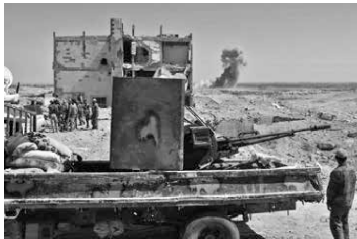
Syrische Regierungstruppen bei der Eroberung der von ISIS-Terroristen kontrollierten T-2-Pumpstation nahe der Stadt Al-Bukamal an der Grenze zum Irak im September 2017.

Etablierung von neuen, in den USA ausgebildeten und neoliberal geschulten Führungseliten und die Durchführung von Wahlen [...]“ [8]