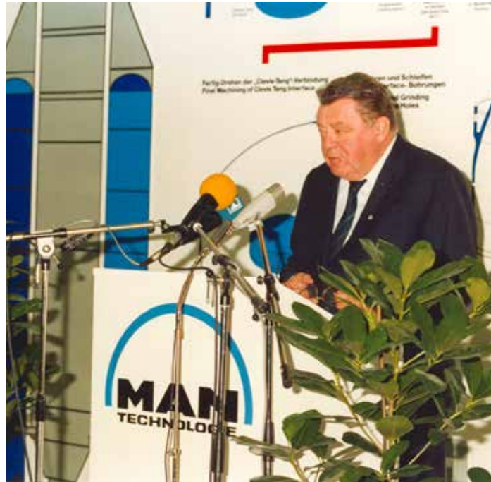
Der bayerische Ministerpräsident Franz Josef Strauß spricht bei der Eröffnung der Produktionsstätte für die Ariane 5-Boostersegmente am 30. September 1988 bei MT in Augsburg (ein Tag vor seinem Tod)

1933 waren GHH und MAN nach Kräften bemüht, sich eine günstige Ausgangsposition im Rüstungsgeschäft zu sichern. Die Aussicht auf umfangreiche Erträge des Heeres, der Marine und der Luftwaffe ließ die Nachteile in den Hintergrund treten, die sich aus der nationalsozi-