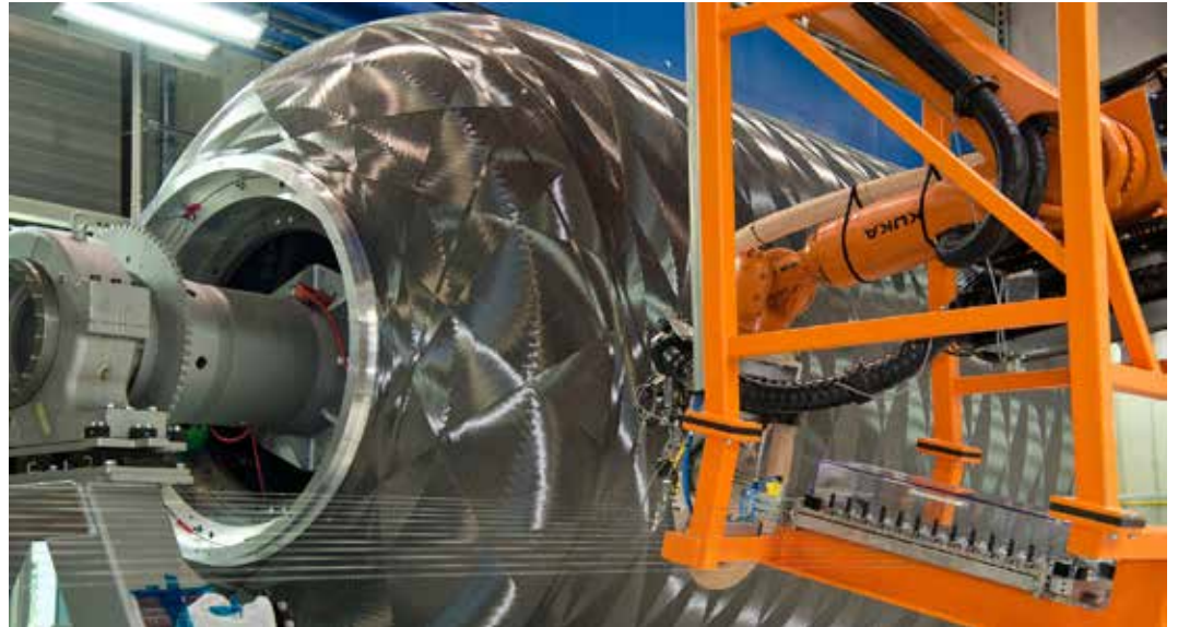
Das Boostergehäuse aus Carbonfasern für die Ariane 6 wurde beim DLR Stuttgart und Augsburg in Kooperation mit MT Aerospace entwickelt und gefertigt.

Der Hauptauftragnehmer Airbus Safran Launchers ist also in der deutschen Öffentlichkeit kaum bekannt und vor allem nicht der volle Umfang seines Rüstungsprogramms. Die Augsburger MT Aerospace AG hat im Juni einen Vertrag mit Airbus Safran Launchers über die Entwicklung wesentlicher Tank- und Struktur-Bauteile für die neue europäische Trägerrakete Ariane 6 abgeschlossen. „Der Auftrag beinhaltet alle erforderlichen Entwicklungsarbeiten im Bereich ‚Tanks und Strukturen‘ bis zum geplanten Erstflug der Rakete im Jahr 2020 ...“, schreibt die Augsburger Allgemeine. [2] Diesen Aspekten wollen wir in einem zweiten Artikel nachgehen. Dabei soll es vor allem um die Rolle von MT Aerospace gehen, seine Bedeutung als Zulieferer für Airbus Safran Launchers und seine Verstrickung in das französische Nuklearprogramm, aber auch um die Bedeutung des Leichtbaus bzw. der Produktion mit Carbonfasern auch