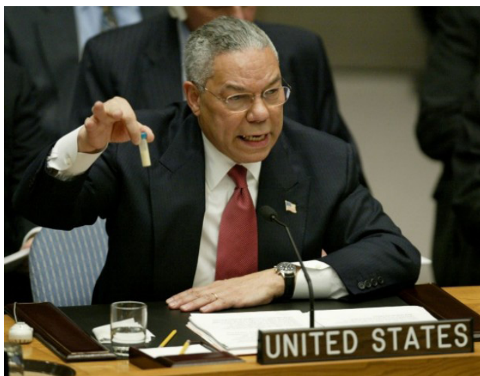
Der US-amerikanische Außenminister Colin Powell mit einem kleinen durchsichtigen Röhrchen in der Hand als „Beweis“ von Massenvernichtungswaffen in Irak - was Colin Powell aber verschwiegen hat: Schon im ersten Irakkrieg 1991 haben die USA und ihre Alliierten zum ersten Mal Massenvernichtungswaffen in Form von vielen Tonnen Bomben und Granaten aus abgereichertem Uran eingesetzt.

Eine Erklärung für das Schweigen der Leitmedien über den Einsatz von Uranwaffen und dessen Folgen sei, meint Claus Biegert, dass mächtige Institutionen gar kein Interesse an einer Diskussion des Themas haben, denn das internationale Recht sieht vor: Für die Beseitigung von Kriegsmaterial, vergifteten Böden und Wasser sind die Verursacher verantwortlich. Für zivile Opfer müssten sie sich vor dem Internationalen Gerichtshof verantworten. Eine Ächtung der Uranwaffen schmälere nicht nur die Gewinne der Waffen- und Transportindustrie, sondern sie werfe auch Fragen der Entschädigung auf, die nicht vorgesehen waren [2].