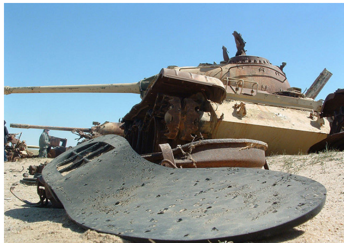
„Highway of death“, Irak 2003

rer Brennstäbe aus Uran 235 für die Atomindustrie. Es enthält aber noch etwa 60 Prozent der Radioaktivität des ursprünglichen Uranerzes aufgrund seines hohen Gehaltes an Uran 238, einem langsam zerfallenden Alpha-Strahler mit einer Halbwertszeit von 4,5 Milliarden Jahren [2].