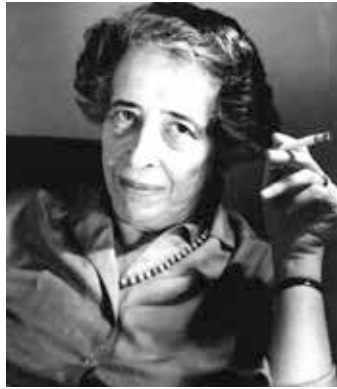
Hannah Ahrendt

Jeder von uns kennt das. Die meisten haben Angst, sich vor eine größere Menschenansammlung zu stellen und frei zu sprechen. Sie durchbrechen damit ein sicheres soziales Gefüge, und ihr Instinkt