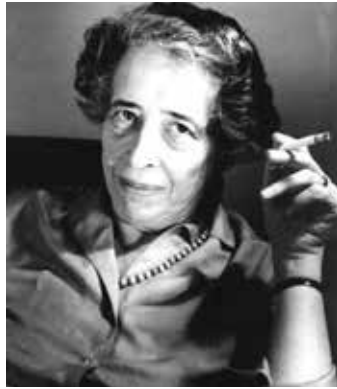
Hannah Ahrendt

Jeder von uns kennt das. Die meisten haben Angst, sich vor eine größere Menschenansammlung zu stellen und frei zu sprechen. Sie durchbrechen damit ein sicheres soziales Gefüge, und ihr Instinkt