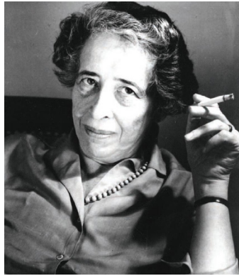
Hannah Ahrendt

Jeder von uns kennt das. Die meisten haben Angst, sich vor eine größere Menschenansammlung zu stellen und frei zu sprechen. Sie durchbrechen damit ein sicheres soziales Gefüge, und ihr Instinkt