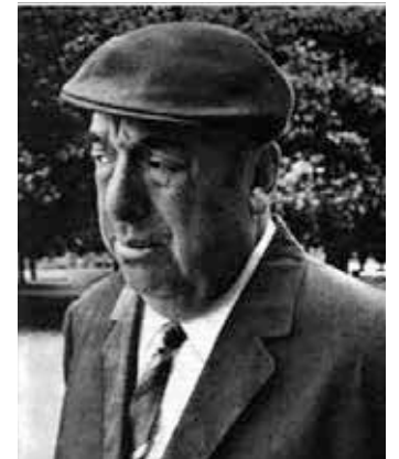
Pablo Neruda; eigentlich Neftalí Ricardo Reyes Basoalto (* 12. Juli 1904 in Parral; † 23. September 1973 in Santiago de Chile), war ein chilenischer Dichter und Schriftsteller, der sich vor allem gegen den Faschismus in seinem Heimatland und in Spanien einsetzte. 1971 erhielt er den Nobelpreis für Literatur.

Ich sagte vorhin, die Vereinigten Staaten würden ihre Karten jetzt völlig ungeniert auf den Tisch legen. Dem ist genau so. Ihre offiziell verlautbarte Politik definiert sich jetzt als „full spectrum dominance“. Der Begriff stammt nicht