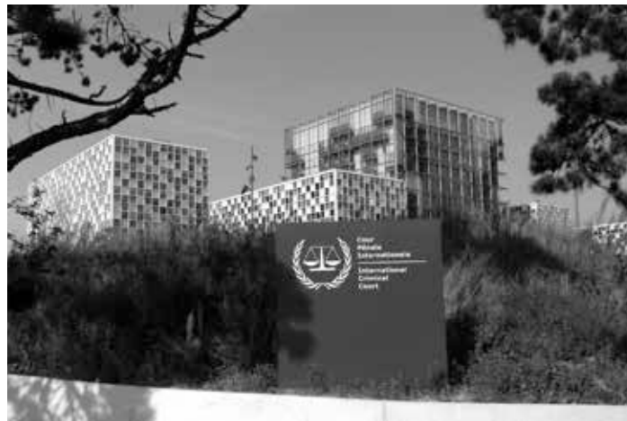
Internationaler Strafgerichtshof, Den Haag

Ganz zu Beginn der Invasion veröffentlichten die britischen Zeitungen auf der Titelseite ein Foto von Tony Blair, der einen kleinen irakischen Jungen auf die Wangen küsst. „Ein dankbares Kind“, lautete die Überschrift. Einige Tage später gab es auf einer In-