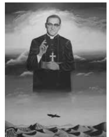
Óscar Arnulfo Romero y Galdámez (* 15. August 1917 in Ciudad Barrios, El Salvador; † 24. März 1980 in San Salvador) war Erzbischof von San Salvador

Ich erwähnte vorhin das „Lüggenspinst“, das uns umgibt. Präsident Reagan beschrieb Nicaragua meist als „totalitären Kerker“. Die Medien generell und ganz bestimmt die britische Regierung werteten dies als zutreffenden und begründeten Kommentar. Aber tatsächlich gab es keine Berichte über Todesschwadronen unter der sandinistischen Regierung. Es gab keine Berichte über Folterungen. Es gab keine Berichte über systematische oder offiziell autorisierte militärische Brutalität. In Nicaragua wurde nie ein Priester ermordet. Es waren vielmehr drei Priester an der Regierung beteiligt, zwei Jesuiten und ein Missionar des Maryknoll-Ordens. Die totalitären Kerker befanden sich eigentlich nebenan in El Salvador