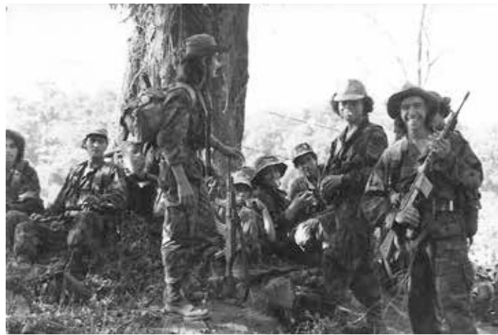
Contra-Rebellen bei einer Zigarettenpause. Der Contra-Krieg war ein von 1981 bis 1990 mit maßgeblicher Unterstützung der Vereinigten Staaten geführter Guerilla-Krieg gegen die linksgerichtete sandinistische Regierung Nicaraguas.

Raymond Seitz besaß einen ausgezeichneten Ruf als rationaler, verantwortungsbewusster und