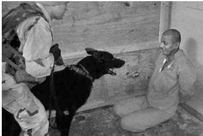
Foto von offensichtlichem Abu Ghraib-Gefängnismissbrauch

Asche zu Asche andererseits scheint mir unter Wasser zu spielen. Eine ertrinkende Frau reckt durch die Wellen die Hand nach oben, sie versinkt, sucht nach anderen, aber sie findet dort niemand,