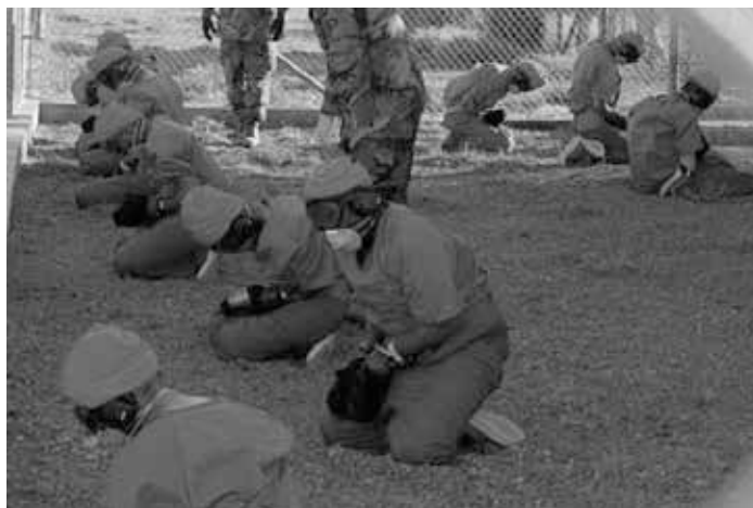
Gefangene in orangefarbenen Jumpsuits sitzen in einem Haltebereich unter den wachsamen Augen der Militärpolizei im Camp X-Ray am Marinestützpunkt Guantanamo Bay, Kuba, während sie am 11. Januar 2002 in die provisorische Haftanstalt eingewiesen werden.

In diesen Ländern hat es Hunderttausende von Toten gegeben. Hat es sie wirklich gegeben? Und