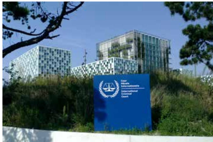
Internationaler Strafgerichtshof, Den Haag

Ganz zu Beginn der Invasion veröffentlichten die britischen Zeitungen auf der Titelseite ein Foto von Tony Blair, der einen kleinen irakischen Jungen auf die Wangen küsst. „Ein dankbares Kind“, lautete die Überschrift. Einige Tage später gab es auf einer In-