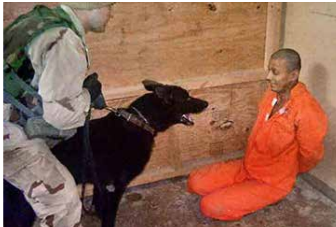
Foto von offensichtlichem Abu Ghraib-Gefängnismissbrauch Quelle: https://commons.wikimedia.org/wiki/File:Abu_Ghraib_56.jpg Foto: Descendall, Lizenz: gemeinfrei

Asche zu Asche andererseits scheint mir unter Wasser zu spielen. Eine ertrinkende Frau reckt durch die Wellen die Hand nach oben, sie versinkt, sucht nach anderen, aber sie findet dort niemand,