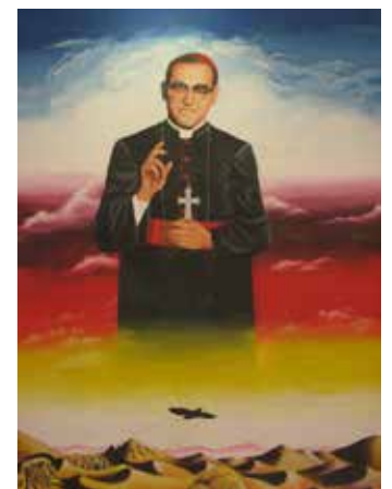
Óscar Arnulfo Romero y Galdámez (* 15. August 1917 in Ciudad Barrios, El Salvador; † 24. März 1980 in San Salvador) war Erzbischof von San Salvador

Ich erwähnte vorhin das „Lüggespinnst“, das uns umgibt. Präsident Reagan beschrieb Nicaragua meist als „totalitären Kerker“. Die Medien generell und ganz bestimmt die britische Regierung werteten dies als zutreffenden und begründeten Kommentar. Aber tatsächlich gab es keine Berichte über Todesschwadronen unter der sandinistischen Regierung. Es gab keine Berichte über Folterungen. Es gab keine Berichte über systematische oder offiziell autorisierte militärische Brutalität. In Nicaragua wurde nie ein Priester ermordet. Es waren vielmehr drei Priester an der Regierung beteiligt, zwei Jesuiten und ein Missionar des Maryknoll-Ordens. Die totalitären Kerker befanden sich eigentlich nebenan in El Salvador