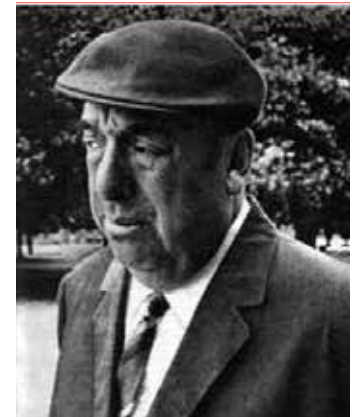
Pablo Neruda; eigentlich Neftalí Ricardo Reyes Basoalto (* 12. Juli 1904 in Parral; † 23. September 1973 in Santiago de Chile), war ein chilenischer Dichter und Schriftsteller, der sich vor allem gegen den Faschismus in seinem Heimatland und in Spanien einsetzte. 1971 erhielt er den Nobelpreis für Literatur.

Ich sagte vorhin, die Vereinigten Staaten würden ihre Karten jetzt völlig ungeniert auf den Tisch legen. Dem ist genau so. Ihre offiziell verlautbarte Politik definiert sich jetzt als „full spectrum dominance“. Der Begriff stammt nicht