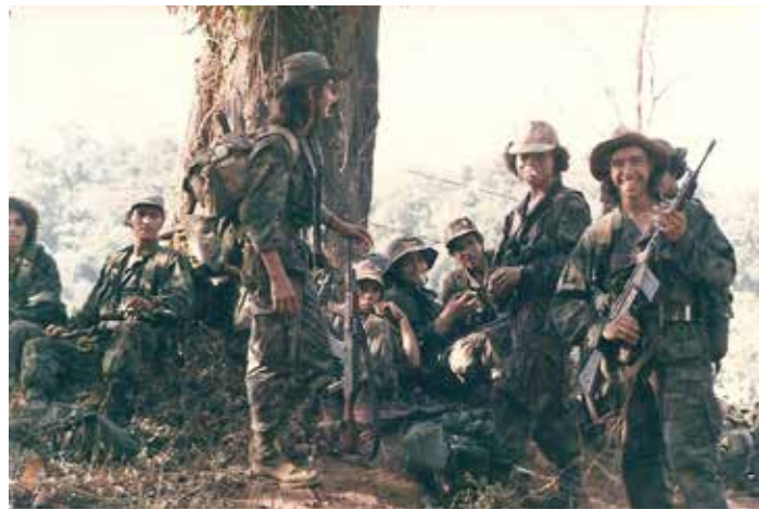
Contra-Rebellen bei einer Zigarettenpause. Der Contra-Krieg war ein von 1981 bis 1990 mit maßgeblicher Unterstützung der Vereinigten Staaten geführter Guerilla-Krieg gegen die linksgerichtete sandinistische Regierung Nicaraguas.

Raymond Seitz besaß einen ausgezeichneten Ruf als rationaler, verantwortungsbewusster und