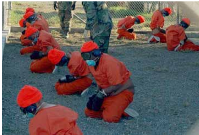
Gefangene in orangefarbenen Jumpsuits sitzen in einem Haltebereich unter den wachsamen Augen der Militärpolizei im Camp X-Ray am Marinestützpunkt Guantanamo Bay, Kuba, während sie am 11. Januar 2002 in die provisorische Haftanstalt eingewiesen werden.

In diesen Ländern hat es Hunderttausende von Toten gegeben. Hat es sie wirklich gegeben? Und