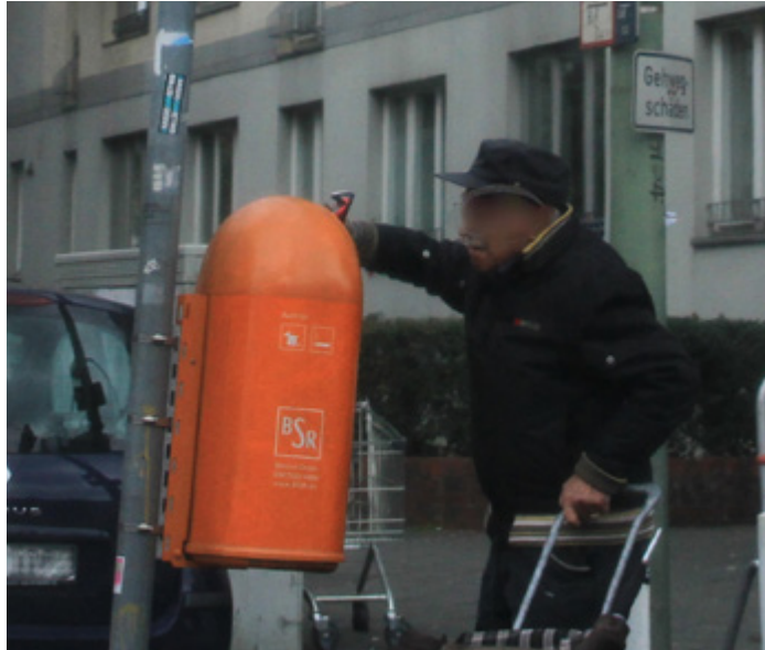
Armut im Alter - Weil die kleine Rente nicht reicht müssen viele Rentner Flaschen sammeln um sich was dazu zu verdienen

Dass dies nicht stimmt, ist einfach belegt: Selbst wenn eine Verkäuferin in Teilzeit einen geringeren Lohn bekäme, könnte sie, anders als jemand, der nicht arbeitet, entweder Wohngeld beantragen oder aufstocken. Bekommt sie zusätzlich Hartz IV, kann sie