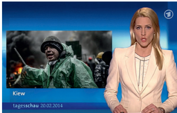
ARD-Tagesschau vom 20. Februar 2014.