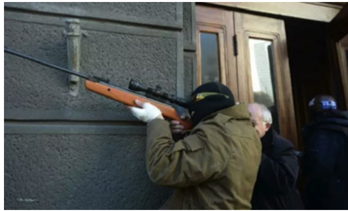
Maidan-Aktivistinnen waren mit Schusswaffen ausgestattet, hier ein Foto vom 18. Februar 2014, wo ein verummter Aktivist allerdings wohl nur mit einem Knicklauf-Luftgewehr auf ein Ziel zu schießen scheint.

Davon ganz abgesehen: Richtig wäre es, im Fall der Georgier nach journalistischen Kriterien zu handeln. Also nicht zu schauen, ob