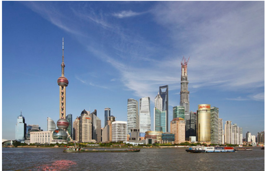
Shanghai, China.

Ja, es mag sein, dass sechs Stadtprojekte in den Weiten die-