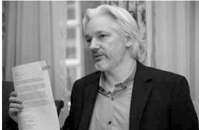
Wikileaks-Chef Julian Assange

Während kein Cent bei WikiLeaks hängenblieb, führte ein