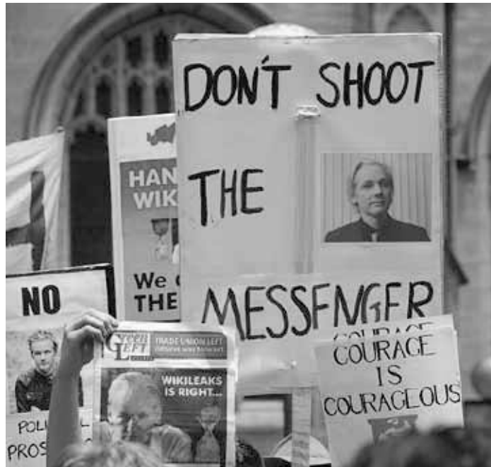
Demonstration vor der Sydney Town Hall zur Unterstützung von Julian Assange, 10. Dezember 2010

Freund, einen Menschen von außerordentlicher Belastbarkeit und Mut. Ich habe mitbekommen, wie ihn ein Tsunami von Lügen und Verleumdungen überflutet hat, unaufhörlich, rachsüchtig, hintertrieben; und ich weiß, weshalb sie ihn verleumdete.