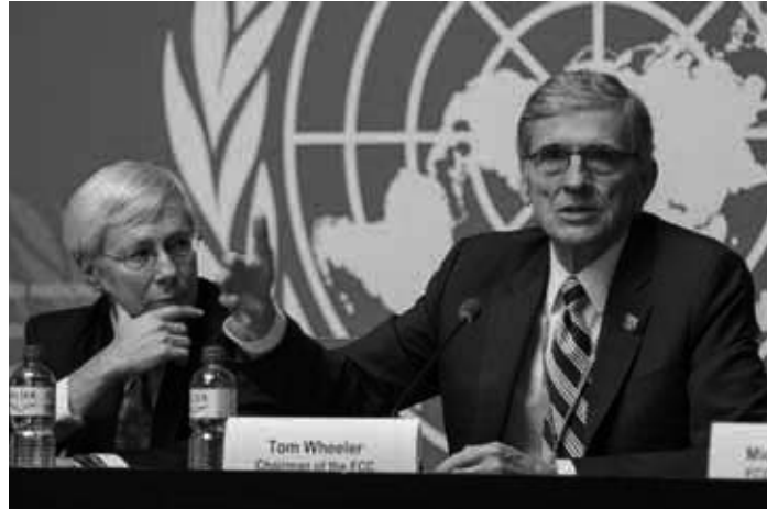
Tom Wheeler von 1992 bis 2004 Vorsitzender der Cellular Telecommunications & Internet Association.