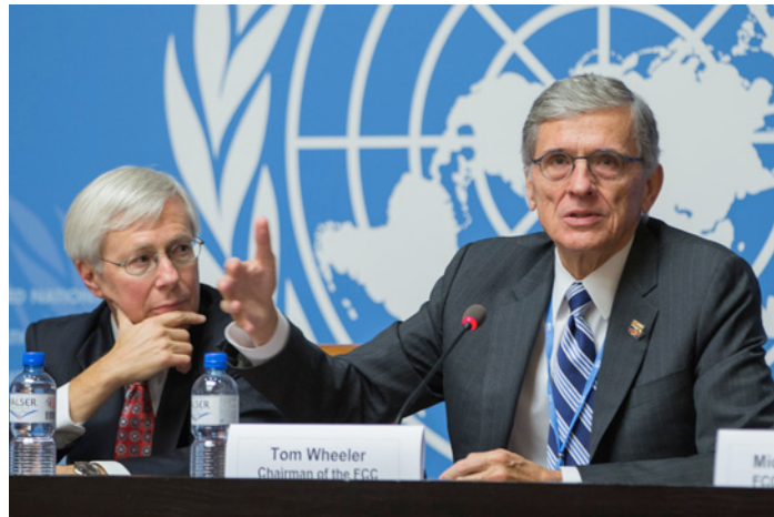
Tom Wheeler von 1992 bis 2004 Vorsitzender der Cellular Telecommunications & Internet Association.