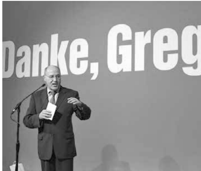
Gysis Abschied als Fraktionsvorsitzender 2015

allermeisten Themen eben nicht an internationale Gremien ausgliedert wurden.