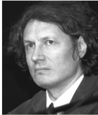
Andrei Nekrasov (2007), Von Elke Wetzig (Elya 19:36, 19 March 2007 (UTC)) - Eigenes Werk, CC BY-SA 3.0, https://commons.wikimedia.org/w/index.php?curid=1809617

Nach der geplatzten Premiere im Europäischen Parlament am 27. April 2016 und der darauf folgen-