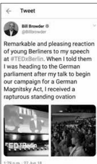
Tweet vom 27. Juni 2018 [3]

Da unser Dokumentarfilm immer noch nicht veröffentlicht werden darf, ist nur Browders Version der Affäre bekannt, die er erfolgreich international weiter verbreitet. Bill Browder war früher ein