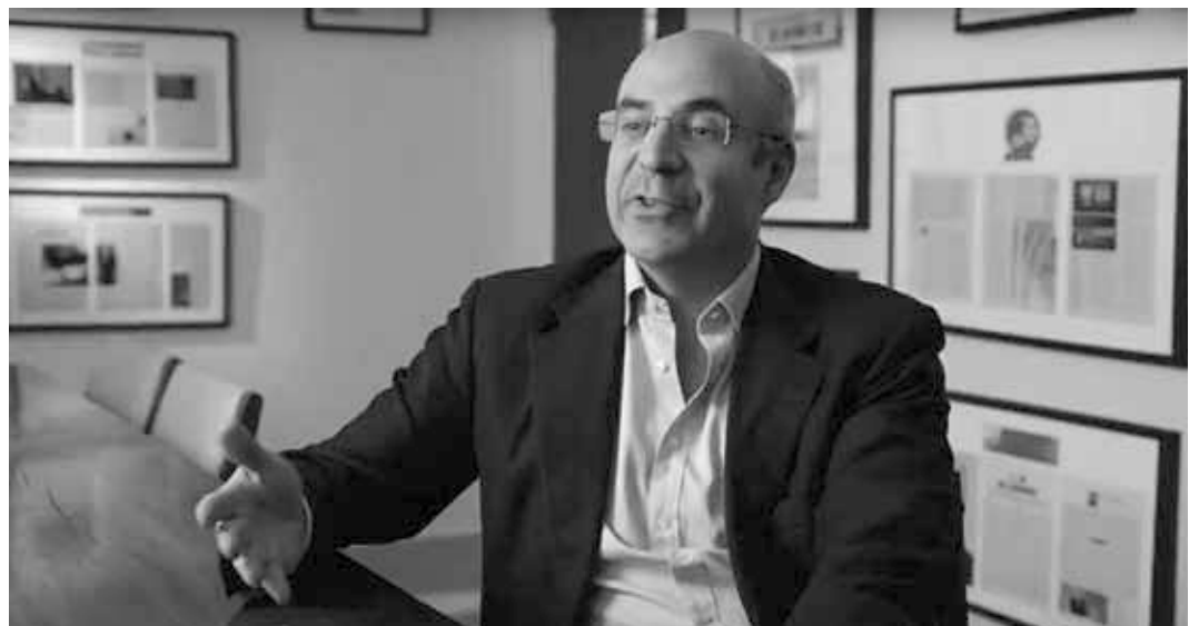
Bill Browder (Screenshot aus dem Trailer zur Dokumentation)

Wer ist Bill Browder? Welche Geschichte erzählt er erfolgreich seit acht Jahren überall in der Welt? Welches Gesetz lobbyiert er so hartnäckig in verschiedenen Ländern und warum? Wir haben versucht, diese Fragen in einem Film zu beantworten. Wir sind zur Schlussfolgerung gekommen, dass der Fall Browder im