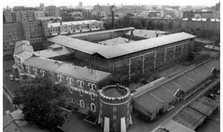
[11] Untersuchungshaftanstalt Nummer 2 „Butyrka“ in Moskau, in dem Magnitski inhaftiert war.

Kein Wunder, dass die Welt vom „Whistleblower“ Magnitski nichts gehört hat, weder zum Zeitpunkt seiner angeblich sensationellen Enthüllung, noch nach seiner Verhaftung, weil Browder erst nach Sergei Magnitskis Tod auf die Idee gekommen ist, ihn zum Whistleblower-Helden zu erklären.