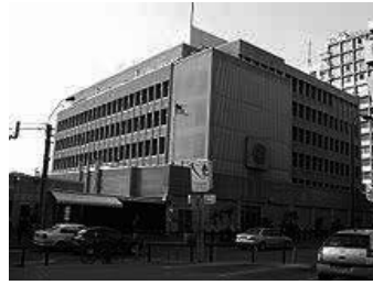
Die Botschaft der USA in Tel Aviv zog am 14.05.2018 nach Jerusalem um. Zuvor hatten die USA Jerusalem als Hauptstadt von Israel anerkannt.

Der saudische Kronprinz Mohammed bin Salman, mit internen Unruhen konfrontiert [9], begann aus Eitelkeit den Krieg im Jemen, als einen Berechtigungsnachweis seiner Fähigkeiten als militärischer Führer. Jetzt versucht er verzweifelt, vom Schlamassel und der humanitären Krise abzulenken, die er angerichtet hat.