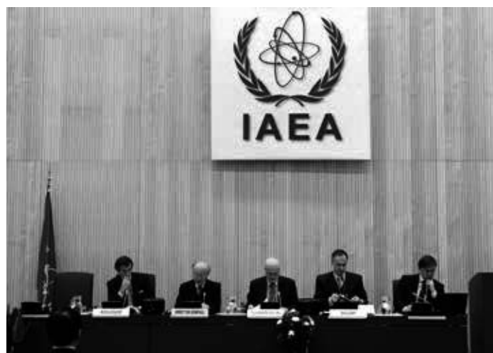
Die Internationale Atomenergie-Organisation (IAEO; englisch International Atomic Energy Agency, IAEA) ist eine autonome wissenschaftlich-technische Organisation, die innerhalb des Systems der Vereinten Nationen einen besonderen Status innehat. Sie berichtet regelmäßig der Generalversammlung der Vereinten Nationen und darüber hinaus dem Sicherheitsrat der Vereinten Nationen, wenn sie eine Gefährdung der internationalen Sicherheit feststellt.

ist seitdem passiert? In den letzten zwei Jahren hat es 11 Berichte der IAEA [7] gegeben, die klar besagen, dass der Iran alle Auflagen des Atomabkommens erfüllt. Alle Behauptungen, der Iran nutze Atomanlagen für militärische Zwecke, wurden von der IAEA, sowie von der EU, Russland, China und vielen anderen asiatischen, lateinamerikanischen und afrikanischen Ländern widerlegt. Den USA geht es um den Einfluss des Iran in der Region, den sie einzudämmen suchen, weil die US-