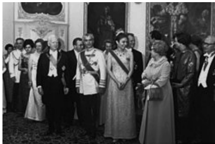
Der 1979 gestürzte Schah Mohammad Reza Pahlavi während eines Besuchs 1967 in Berli. Quelle: https://de.wikipedia.org/wiki/Demonstration_am_2._Juni_1967_in_West-Berlin Foto: wikipedia, Lizenz: public domain.

„Als Partei [im jemenitischen Bürgerkrieg] ist Saudi-Arabien eine taktische und strategische Kooperation mit Israel gegen den Iran eingegangen“, fuhr der Botschafter fort. „Aber das saudische Regime ignoriert die Meinung seines eigenen Volkes. Wie lange kann das so weitergehen? Seit drei Jahren nun wirft Saudi-Arabien mit Unterstützung der USA Bomben auf das jemenitische Volk und verhängt eine Totalblockade, die Nahrungs- und Arzneimittel