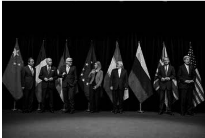
Minister Kerry stellte am 14. Juli 2015 zusammen mit seinen Kollegen E.U., P5 + 1 und iranischen Kollegen im Austria Center in Wien, Österreich, kurz nach der formellen Ankündigung des Abkommens über den Abschluss der iranischen Atomverhandlungen ein Gruppenfoto zusammen.

„Präsident Trump aber nannte das Abkommen bereits als Präsidentschaftskandidat ‚den schlechtesten Deal aller Zeiten‘“, sagte der Botschafter. „Er nannte das Abkommen peinlich für Amerika. Es war aber nicht der Deal, sondern die Entscheidung, einseitig aus diesem vom UN-Sicherheitsrat gebilligten, von den USA mit ausgearbeiteten und finanzierten Abkommen auszusteigen, die Amerika der Lächerlichkeit preisgab. Aus einem internationalen Abkommen auszusteigen und dann einen sou-