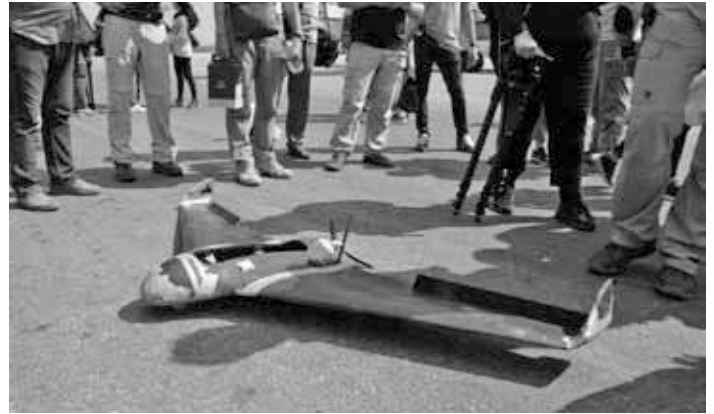
Überreste einer eineinhalb Meter großen Leichtbau-Drohne auf dem Flughafen in Latakia.

den Waffenstillstand zwischen Israel und Syrien überwachen, 2014 aber wegen des Krieges in Syrien von ihren Beobachtungsposten abzogen.