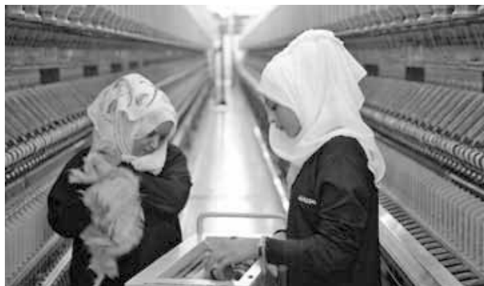
Eine Spinnerei im Industriegebiet von Aleppo.

Als wir Aleppo abends nach Sonnenuntergang verlassen, ist das Bild widersprüchlich. Die Geschäfte im Erdgeschoss der Wohnhäuser sind hell erleuchtet, die Kundschaft geht ein und aus. Doch in den oberen Etagen sieht man kaum Lichter. Der uns begleitende russische Generalmajor meint, die Menschen gingen früh schlafen. Außerdem sei während des Krieges viel von der elektrischen Infrastruktur