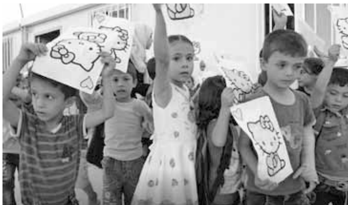
Schulkinder in einem Vorort von Damaskus.

Menschen. Es müssten nur die Bedingungen für die Wiederaufnahme der Wirtschaftstätigkeit geschaffen werden.