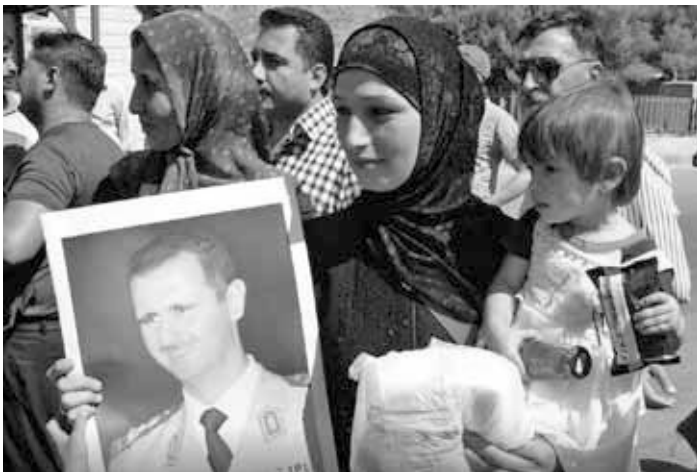
Eine syrische Frau und ihr Kind kehren in ihr Heimatland zurück. Im Arm hält sie ehrwürdig ein Porträt des Präsidenten Assad.

Syrien erwartet, dass der Westen beim Wiederaufbau hilft. Doch bisher gibt es kaum Anzeichen, dass der Westen seine Haltung zu dem vom Krieg geschundenen Land ändert.