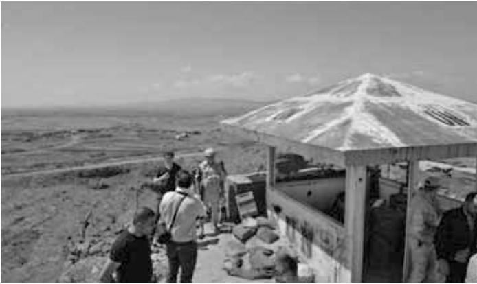
Ehemaliger UN-Beobachter Aussichtspunkt, mit Blick auf die Golan-Höhen.