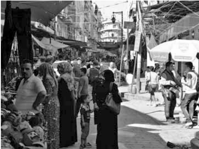
Buntes Treiben auf einer Marktstraße in Aleppo.

syrischen Sprache“, sagt Aleksandr, ein russischer Offizier, der unsere Gruppe begleitet.