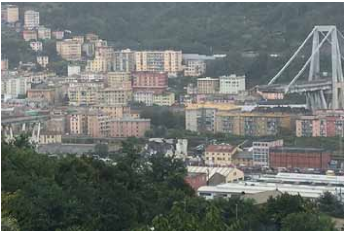
Ponte Morandi, anderer Name für den Polcevera-Viadukt, 2018 eingestürzte Autobahnbrücke in Genua. Quelle: https://de.m.wikipedia.org/wiki/Datei:Ponte_morandi_crollato_(cropped).jpg , Foto: Salvatore1991, Lizenz: CC BY-SA 4

und die Verantwortlichen werden hoffentlich ermittelt.