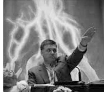
McCain traf den Mitbegründer der faschistischen Sozial-Nationalen Partei Oleh Tyanhbok.

„Die Ukraine wird Europa nützen und Europa der Ukraine!“, rief McCain unter dem Jubel der Massen, während Tyanhbok an seiner Seite stand. Das Einzige, was ihn damals interessierte, war die Weigerung des gewählten Präsidenten