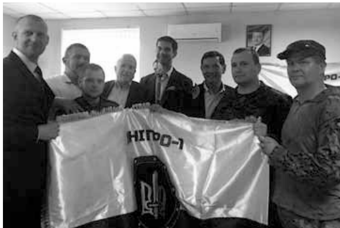
McCain mit Dnipro-1 Milizsoldaten am 20. Juni 2015.

ronen in Mittelamerika – für jede Stellvertretergruppe, die auf die Zerstörung kommunistischer Regierungen eingeschworen war.