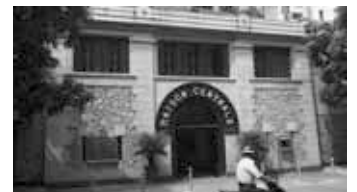
Das „Hanoi Hilton“-Gefängnis, in dem McCain zwei Jahre in Einzelhaft verbrachte und gefoltert wurde.

Aber der verstorbene Senator erhielt auch grundlos Anerkennung von einer Reihe bekannter Linksliberaler, von George Soros [3] bis zu seinem lästigen Klienten Ken Roth, dazu die drei Direktoren von Human Rights Watch [4] und die bekannte „demokratische Sozialistin“ Alexandra Ocasio-