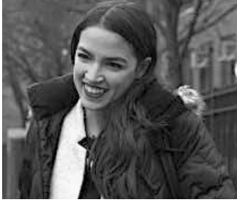
Alexandra Ocasio-Cortez bezeichnete McCain als „einmaliges Beispiel menschlichen Anstands“.

erscheinen, dann deshalb, weil sie die elitäre Sichtweise auf die amerikanischen Militärinterventionen als eine Schachpartie perfekt widerspiegeln, in der Millionen Tote infolge der grundlosen Angriffe des Westens als bloße Statistik erscheinen.