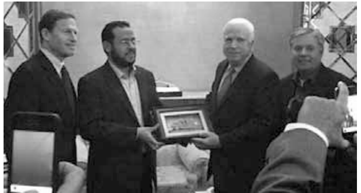
McCain mit Abdelhakim Belhaj, Führer der Libysch-Islamischen Kampfgruppe, einer der größten Rebellenorganisationen.

Nach dem von der NATO organisierten Mord an Libyens Führer twitterte McCain: „Gaddafi auf dem Weg nach draußen, Bashar al-Assad ist der Nächste.“ [13]