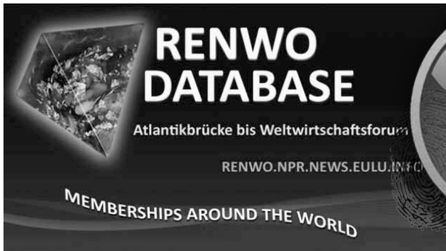
Linkes Bild: Die RENWO-Datenbank ist für registrierte Benutzer kostenfrei einsehbar. Rechts + unten: Symbolbilder