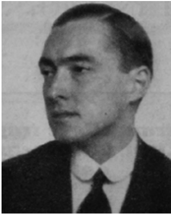
Richard Nikolaus Graf von Coudenhove-Kalergi (1894–1972) war ein österreichischer Schriftsteller, Politiker und Gründer der Paneuropa-Bewegung

genen Jahr auch ein CIA-Whistleblower, dem das gleiche passiert war. So etwas scheint zum Standardrepertoire zu gehören.