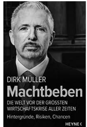
Das Buch von Dirk Müller „Machtbeben“