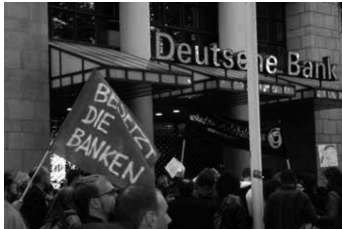
Occupy-Demonstration am 15. Oktober 2011 in Düsseldorf

In diesem Zusammenhang erinnert er an Wolfram Siener. Der damals 20-jährige hatte im Oktober 2011, auf dem Höhepunkt der Occupy-Bewegung, medial Furore gemacht. In der ZDF-Talksen-