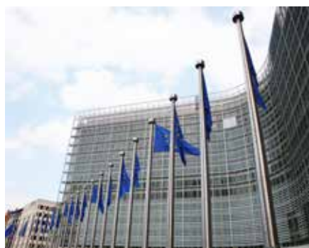
Das 1963 bis 1967 erbaute Berlaymont-Gebäude in Brüssel ist der Sitz der Europäischen Kommission

Für deutsche Leser sind Diesens Hinweise zur Position Europas besonders relevant und interessant. Die EU sei eine „bürokratische und regulatorische Supermacht“, die Zugang zu ihrem enormen Markt nur unter Akzeptanz diskriminierender Bedingungen erlaubt und sich so ein Netz