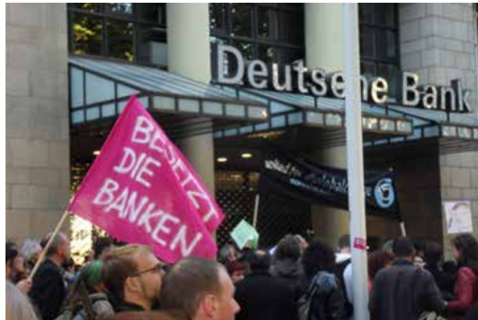
Occupy-Demonstration am 15. Oktober 2011 in Düsseldorf

In diesem Zusammenhang erinnert er an Wolfram Siener. Der damals 20-jährige hatte im Oktober 2011, auf dem Höhepunkt der Occupy-Bewegung, medial Furore gemacht. In der ZDF-Talksen-