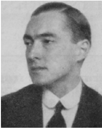
Richard Nikolaus Graf von Coudenhove-Kalergi (1894–1972) war ein österreichischer Schriftsteller, Politiker und Gründer der Paneuropa-Bewegung

genen Jahr auch ein CIA-Whistleblower, dem das gleiche passiert war. So etwas scheint zum Standardrepertoire zu gehören.