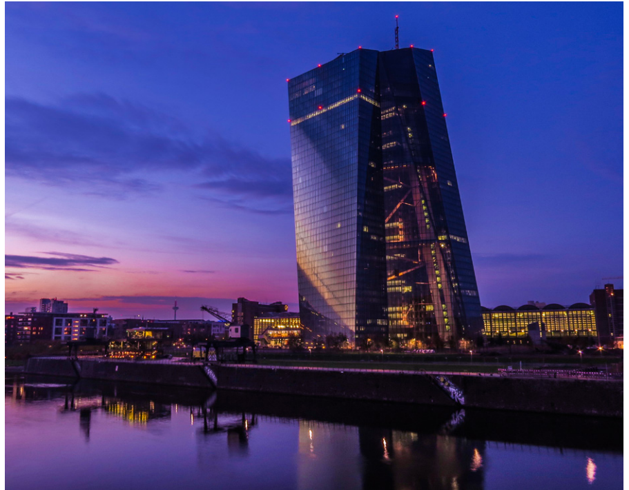
Bild oben: Neubau der Europäischen Zentralbank in Frankfurt am Main