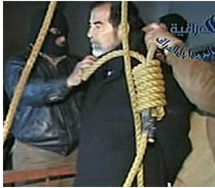
Saddam Hussein (* 28.04.1937 in al-Audscha bei Tikrit; † 30.12.2006 in al-Kazimiyya bei Bagdad) war von 1979 bis 2003 Staatspräsident und gleichzeitig von 1979 bis 1991 sowie 1994 bis 2003 Premierminister des Irak.

1997, sie war gerade Außenministerin unter Präsident Bill Clinton geworden, nahm sie an einem informellen Frühstück im Büro des Sicherheitsberaters teil. Zu dieser Zeit führten die USA Überwachungsflüge über dem Irak mit U-2-Jets durch, die in großer Höhe operierten. Albright nahm beim Frühstück den ranghöchsten US-Militär, den Chef des Vereinigten Generalstabs, Hugh Shelton, vertraulich zur Seite und machte ihm einen Vorschlag: „Hugh, ich weiß, dass ich Sie das nicht fragen sollte, aber um in den Irak zu gehen und Saddam ausschalten zu können, brauchen wir ein wirklich extremes Ereignis