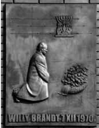
Willy Brandt Gedenktafel in Warschau.