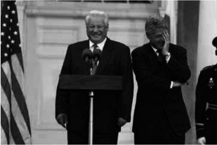
Präsident William Clinton und Präsident Boris Nikolajewitsch Jelzin in Springwood, der Heimat von Franklin Delano Roosevelt in Hyde Park, New York, 23.10.1995.

militaristische Gruppen. Es ist der helle Wahnsinn. Das ist das Gegenteil einer produktiven schöpferischen Strategie, es ist eine Strategie, die zum tödlichen Wandel führen kann.