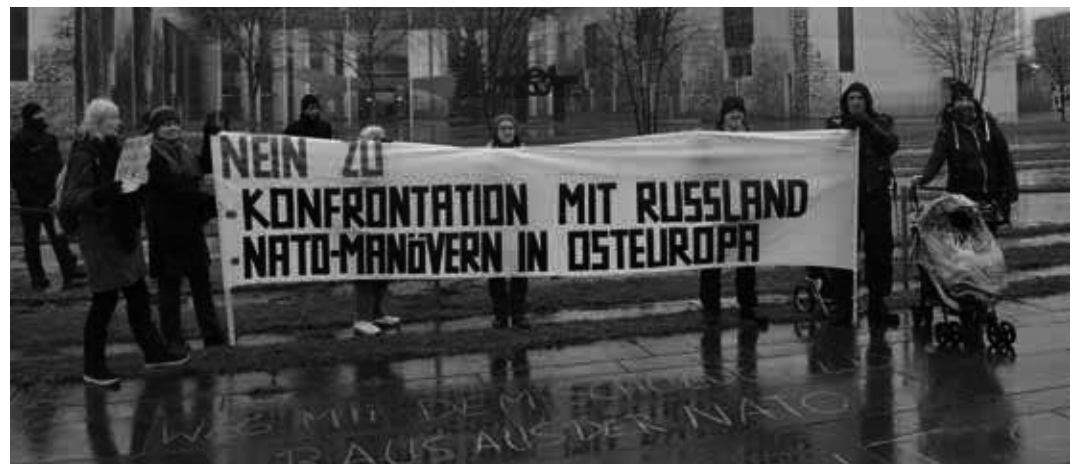
Demonstranten fordern das Ende der Konfrontationspolitik mit Russland, vor dem Bundeskanzleramt.

Frieden, Familienzusammenführung, Warenaustausch, Arbeitsplätze, Reisen, Sich Besuchen. Hinzu kam die emotionale Seite. Willy Brandt sprach von Versöhnung, nicht nur von Vertragspolitik. Und er handelte danach, bedacht oder gefühlsmäßig. Der Kniefall in Warschau hatte eine solche weitreichende emotionale Bedeutung, diesseits und jenseits des Eisernen Vorhangs.