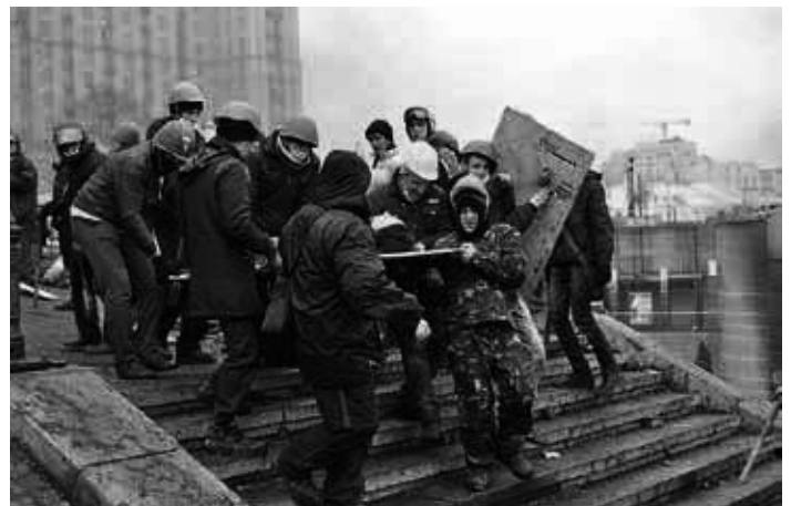
Ab dem 18. Februar 2014 kam es auf dem Maidan zu einer Eskalation, die über 80 Todesopfer forderte. Quelle: https://commons.wikimedia.org/wiki/File:Maidan-Kyiv-14021552.jpg , Foto: Mykola Vasylechko, Lizenz: CC BY-SA-4.0.

Man spürt es schon. Bei einem Interview mit einer jungen russischen Journalistin zum Thema Außenpolitik war deutlich zu spüren, dass eine Trotzreaktion ins Haus steht. Verletzter Stolz ist der emotionale Treibstoff beim Aufbau neuer Konfrontation. So wird der Westen mit seinem Verhalten dazu beitragen, dass es in Russland einen Wandel zum Schlechteren gibt: weniger Gastfreundschaft, weniger freundliche und freundschaftliche Gefühle gegenüber den Deutschen, Offenheit für nationalistische und