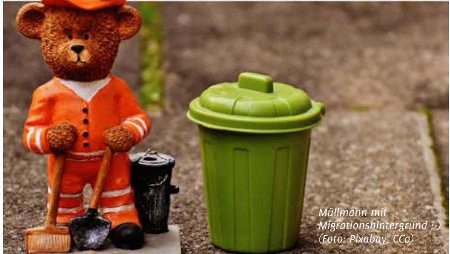
Müllmann mit Migrationshintergrund :-) (Foto: Pixabay, CCo)

[3] < https://www.spdfraktion.de/system/files/documents/leinwanderungsgesetz-spd-bundestagsfraktion.pdf >