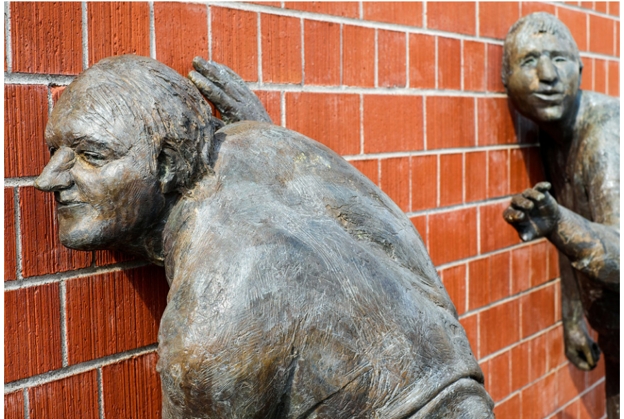
Figur der Skulpturengruppe „Die Lauschenden“ des Bildhauers Karl-Henning Seemann vor der Musikhochschule in Freiburg im Breisgau.

Herr Bröckers, Sie haben eine Streitschrift verfasst, die heißt: „Schnauze, Alexa! Ich kaufe nicht bei Amazon“. Für die Leser, die nicht wissen, wer Alexa ist: Wer ist Alexa? Und: Warum soll Alexa die Schnauze halten?