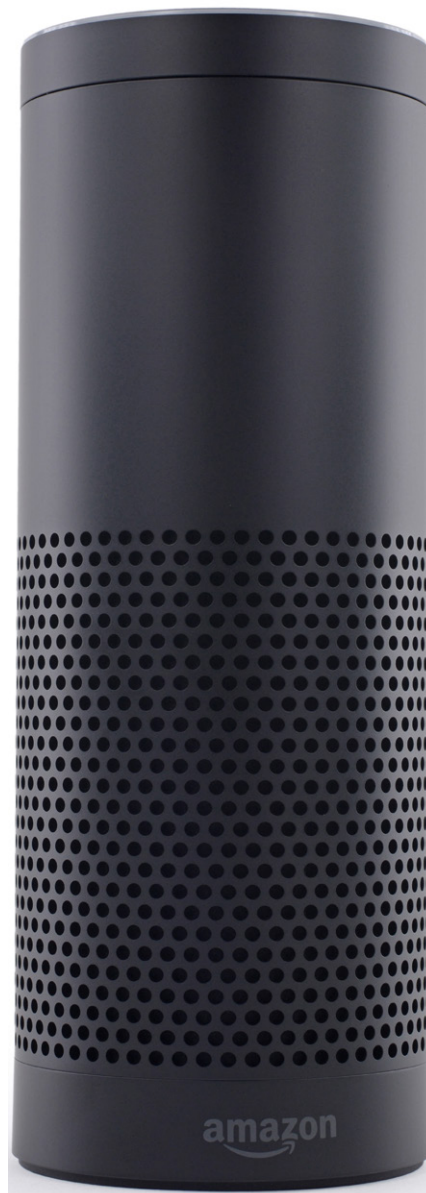
Amazon Echo Bild nächste Seite: Amazon Echo mit ausgeschalteten Mikrofonen

Jeder, der noch einen Rest an kritischem Potenzial zwischen den Ohren hat, weiß doch, dass Amazon im Grunde ein echter Sauladen ist, der seine Mitarbeiter schlecht bezahlt und permanent mit Kameras überwacht, der ganz Branchen plattmacht, Arbeitsplätze vernichtet und natürlich auch zu den großen Steuervermeidern zählt. Trotzdem wächst auch hier in Deutschland der Amazon-Umsatz kontinuierlich weiter, weil wir all diese Fakten ausblenden, wenn uns Amazon mit neuen Angeboten lockt. Wenn ich mal träumen darf, würde ich mir schon wünschen, dass mal alle