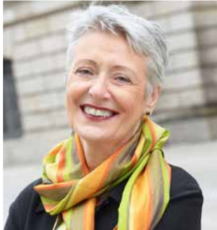
Marieluise Beck