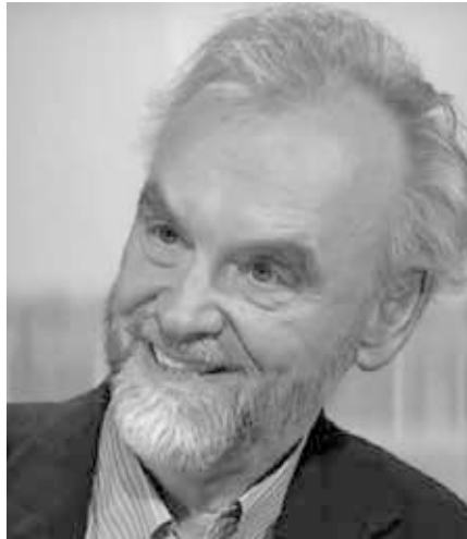
Rainer Mausfeld

Wem der Vergleich der millionenfach tödlichen Auswirkungen des historischen Faschismus und des gegenwärtigen Neoliberalismus dennoch unbehaglich ist, dem steht es frei, sachlich dagegen zu argumentieren. So könnte man etwa versuchen zu belegen, dass die von Ziegler genannten circa 50 Millionen Menschen, die jedes Jahr an Hunger, mangelnder Hygiene und Mangelkrankungen sterben, nicht auf das Konto der herrschenden Wirtschaftsordnung gehen, sondern