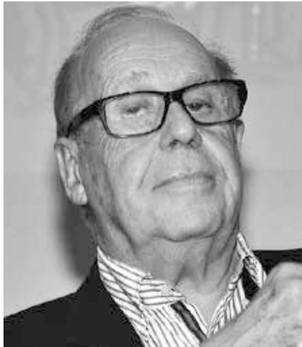
Jean Ziegler