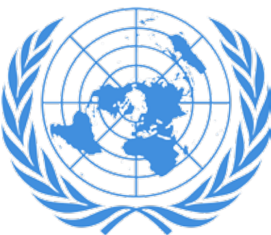
Bild oben: 10. UNCTAD Debt Management Conference am 24.11.2015 mit über 350 Teilnehmern aus über 100 Ländern.

Grafik unten: Das Logo der UNO