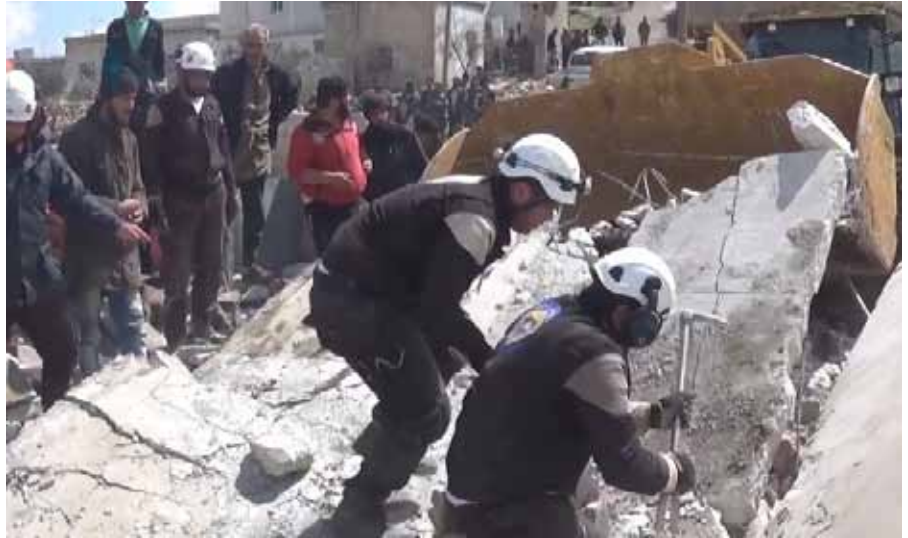
Die Weißhelme sind eine umstrittene private Zivilschutzorganisation von Freiwilligen und bezahlten Helfern in Syrien, die seit 2013 im Bürgerkrieg in nicht von der Regierung kontrollierten Teilen des Landes aktiv ist.

„Zunächst einmal hat HRW keine Untersuchung vor Ort durchgeführt. Die US-Menschenrechtsorganisation verließ sich in ihrer Analyse auf Bildmaterial, dass sie von den mit Al-Kaida verbundenen und vom Westen finanzierten Weißhelmen erhalten hatte – auch die wichtigs-