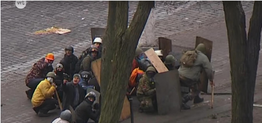
Ausschnitt aus den Aufnahmen des belgischen Senders VRT vom 20. Februar 2014 [9]: Vorrückende Maidankämpfer drehen sich nach Schüssen von hinten um und zeigen auf Schützen im Hotel Ukraina.

Schlüsselbeweis dafür, dass Demonstranten von Scharfschützen aus Maidan kontrollierten Gebäuden im Rücken und aus seitlichen Richtungen erschossen wurden und dass Berkut sie nicht getötet hat.