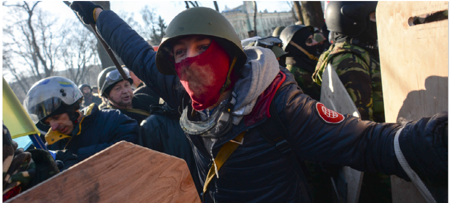
Das Phänomen von Faschisten in der Ukraine existiert seit der Orangen Revolution. Aber diese Netzwerke wurden schon über 50 Jahre lang vorbereitet, aufgebaut und unterstützt [19]

Ich begann mit meiner Untersuchung des Maidan-Massakers im Moment seines Geschehens, weil ich es über Inter-