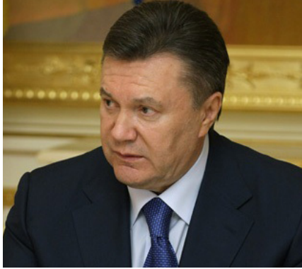
Der ehemalige ukrainische Präsident Viktor Janukowitsch

Es fällt auf, dass fünf Jahre nach dem Massaker niemand wegen Tötungen der Demonstranten und der Polizei auf dem Maidan verurteilt wurde. Immerhin ist es der am besten dokumentierte Fall von Massenmord in der Geschichte. Die Ermittler bestreiten einfach, dass es in den vom Maidan kontrollierten Gebäuden Scharfschützen gab. Das wird nicht untersucht, obwohl eigene Ermittlungen, das Verfahren und die öffentlich verfügbaren Beweise genau das feststellen. Zu den Belegen zählen Aussagen von über 100 verwundeten Demonstranten und über 200