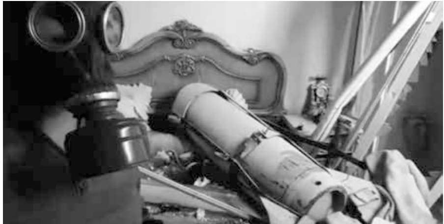
Screenshot aus einem Propaganda-Video zum angeblichen Giftgasangriff in Douma.

Die in Proben gefundenen chlorierten organischen Chemikalien lagen um ein vielfaches unter der Menge, die in der natürlichen Umwelt vorkommen, beispielsweise im Wasser. Dieses Laborergebnis, das Ende Juni vorlag, ist in keinem der beiden Berichte zu finden. Stattdessen heißt es, es seien „ausreichende Begründungen erbracht“ worden, wonach „eine giftige chemische (Substanz) als Waffe eingesetzt wurde. Diese giftige chemische (Substanz) enthielt reaktives Chlor. Die giftige Chemikalie war vermutlich molekulares Chlor.“ Mit anderen Worten, ein „rauchender Colt“ sei gefunden worden, was auch unmittelbar von internationalen Medien so verbreitet wurde. Tatsächlich aber, so die „Quelle Alex“ handelte es sich bei den gefundenen chemischen Substanzen (darunter Bornylchlorid) um Konservierungsmittel „in einer geringeren Dosis als in dem Kaffee ist, den Sie trinken.“ In einer internen Korrespondenz heißt es: „In den meisten Fällen waren sie nur in „Spuren“ erkennbar, in Teilen pro Milliarde,