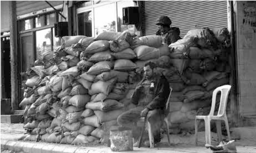
Syrische Soldaten in Douma

gegenüber dem Untersuchungsteam und auch der internationalen Öffentlichkeit zu sprechen [2]. Eingeladen hatte die Courage Stiftung [3], die Whistleblower wie Julian Assange und Edward Snowden unterstützt.