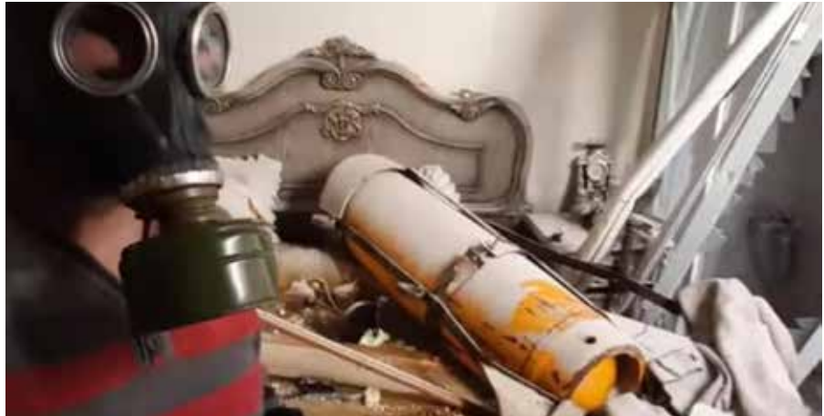
Screenshot aus einem Propaganda-Video zum angeblichen Giftgasangriff in Douma.

Die in Proben gefundenen chlorierten organischen Chemikalien lagen um ein vielfaches unter der Menge, die in der natürlichen Umwelt vorkommen, beispielsweise im Wasser. Dieses Laborergebnis, das Ende Juni vorlag, ist in keinem der beiden Berichte zu finden. Stattdessen heißt es, es seien „ausreichende Begründungen erbracht“ worden, wonach „eine giftige chemische (Substanz) als Waffe eingesetzt wurde. Diese giftige chemische (Substanz) enthielt reaktives Chlor. Die giftige Chemikalie war vermutlich molekulares Chlor.“ Mit anderen Worten, ein „rauchender Colt“ sei gefunden worden, was auch unmittelbar von internationalen Medien so verbreitet wurde. Tatsächlich aber, so die „Quelle Alex“ handelte es sich bei den gefundenen chemischen Substanzen (darunter Bornylchlorid) um Konservierungsmittel „in einer geringeren Dosis als in dem Kaffee ist, den Sie trinken.“ In einer internen Korrespondenz heißt es: „In den meisten Fällen waren sie nur in „Spuren“ erkennbar, in Teilen pro Milliarde,