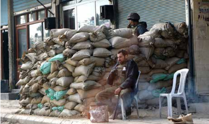
Syrische Soldaten in Douma

gegenüber dem Untersuchungsteam und auch der internationalen Öffentlichkeit zu sprechen [2]. Eingeladen hatte die Courage Stiftung [3], die Whistleblower wie Julian Assange und Edward Snowden unterstützt.