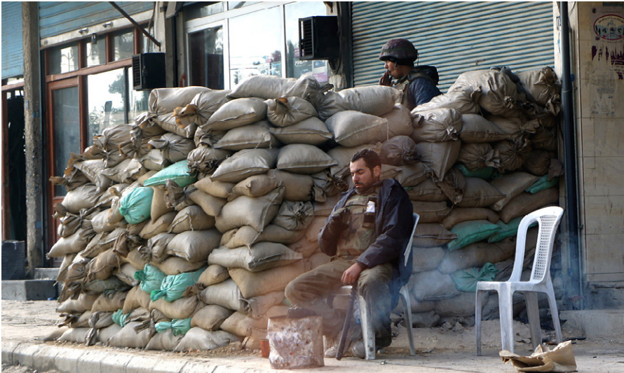
Syrische Soldaten in Douma

gegenüber dem Untersuchungsteam und auch der internationalen Öffentlichkeit zu sprechen [2]. Eingeladen hatte die Courage Stiftung [3], die Whistleblower wie Julian Assange und Edward Snowden unterstützt.