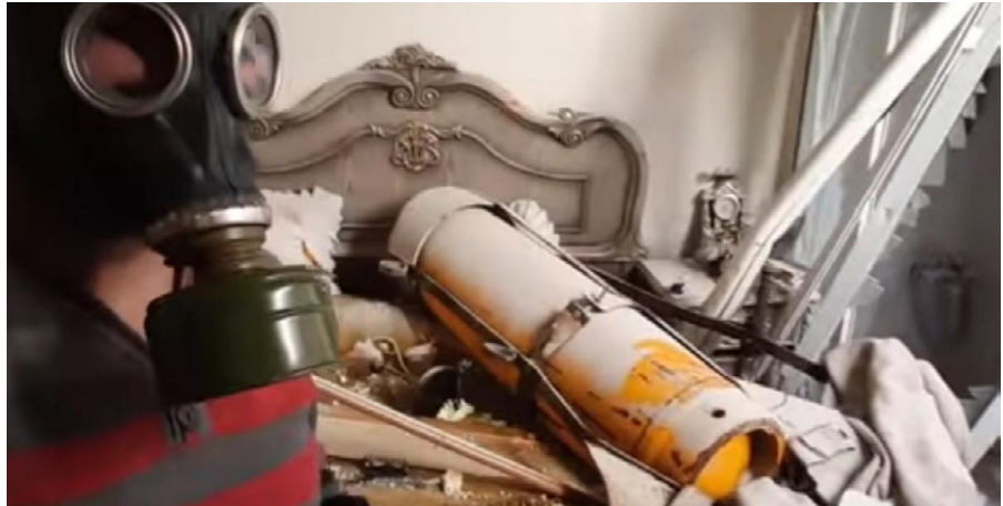
Screenshot aus einem Propaganda-Video zum angeblichen Giftgasangriff in Douma.

Die in Proben gefundenen chlorierten organischen Chemikalien lagen um ein vielfaches unter der Menge, die in der natürlichen Umwelt vorkommen, beispielsweise im Wasser. Dieses Laborergebnis, das Ende Juni vorlag, ist in keinem der beiden Berichte zu finden. Stattdessen heißt es, es seien „ausreichende Begründungen erbracht“ worden, wonach „eine giftige chemische (Substanz) als Waffe eingesetzt wurde. Diese giftige chemische (Substanz) enthielt reaktives Chlor. Die giftige Chemikalie war vermutlich molekulares Chlor.“ Mit anderen Worten, ein „rauchender Colt“ sei gefunden worden, was auch unmittelbar von internationalen Medien so verbreitet wurde. Tatsächlich aber, so die „Quelle Alex“ handelte es sich bei den gefundenen chemischen Substanzen (darunter Bornylchlorid) um Konservierungsmittel „in einer geringeren Dosis als in dem Kaffee ist, den Sie trinken.“ In einer internen Korrespondenz heißt es: „In den meisten Fällen waren sie nur in „Spuren“ erkennbar, in Teilen pro Milliarde,