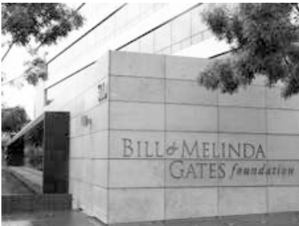
Sitz der Bill und Melinda Gates Foundation in Seattle.

den 1. Platz in der Liste der reichsten Männer der Welt einnehmen würde, weil er 28 Milliarden seines Vermögens gespendet habe. Der Abstieg auf den zweiten Platz in der Liste der Super-Reichen bedeutete aber gleichzeitig, dass Bill Gates den ersten Platz in der Liste der Könige der Herzen erklimmen würde. Gates sprach in einer Rede auf dem Weltwirtschaftsforum in Davos vom „kreativen Kapitalismus“, den er entwickeln werde. Seine Rede hatte einen messianischen Charakter mit Untertönen falscher Bescheidenheit. Mittlerweile hat die wohl-tätige Bill & Melinda Gates Foundation ein Kapital von 51 Milliarden Dollar zur Verfügung.